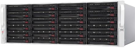
DW-BJE2U / DW-BJER2U DW-BJER3U / DW-BJER4U (los que se muestran)